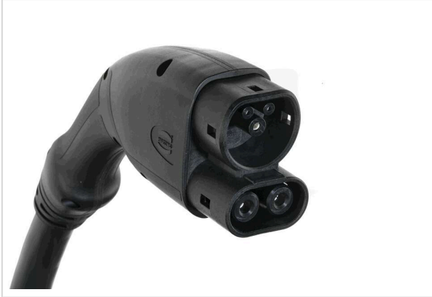
图片仅用于说明。请参考产品描述。