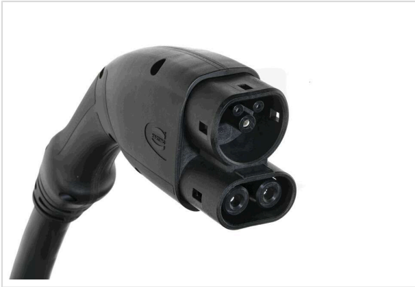
图片仅用于说明。请参考产品描述。